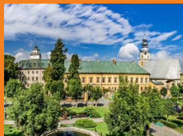
Twierdze, zamki i pałace